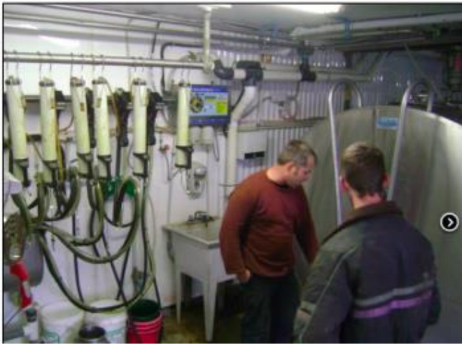
Vue de la laiterie d'une des 28 fermes participantes du projet au Saguenay.

Ces données confirmaient l'innocuité de l'épandage des boues municipales au Québec 41 . C'était une étude vraiment innovante sur le plan international, bien qu'elle était publiée dans une revue francophone.